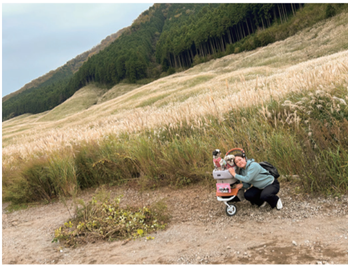
としーざーさん：箱根 仙石原にて 私の大事な家族