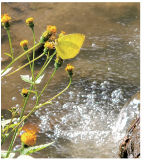
のうさぎさん 短い秋の日を惜しむように黄色モンシロチョウが羽を休めていました。