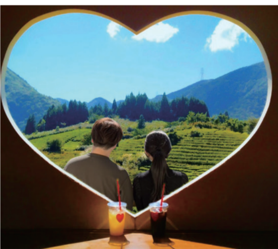
どーもさん 岐阜のマチュピチュの映えスポット！ 本当に綺麗でした！