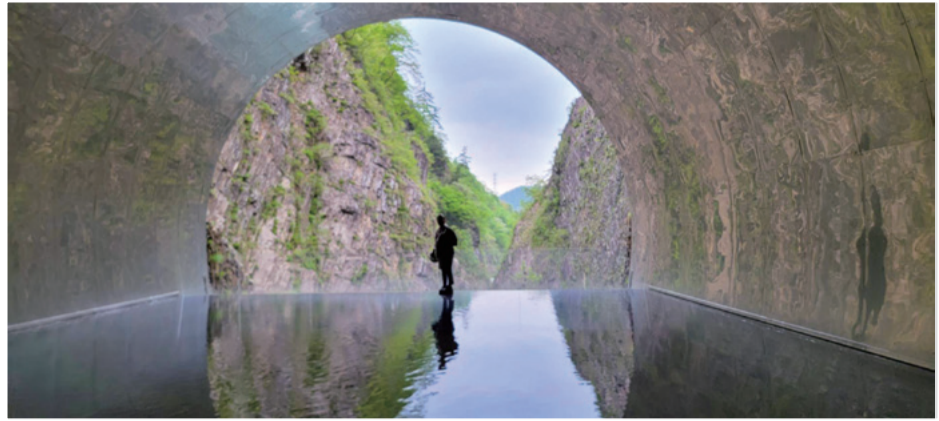
ちびうささん：清津峡でのワンショット