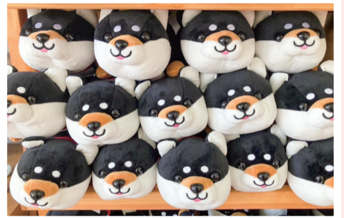
マイマイさん：癒しをもたらす犬のぬいぐるみ