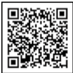
名南会HP採用情報はこちらから。