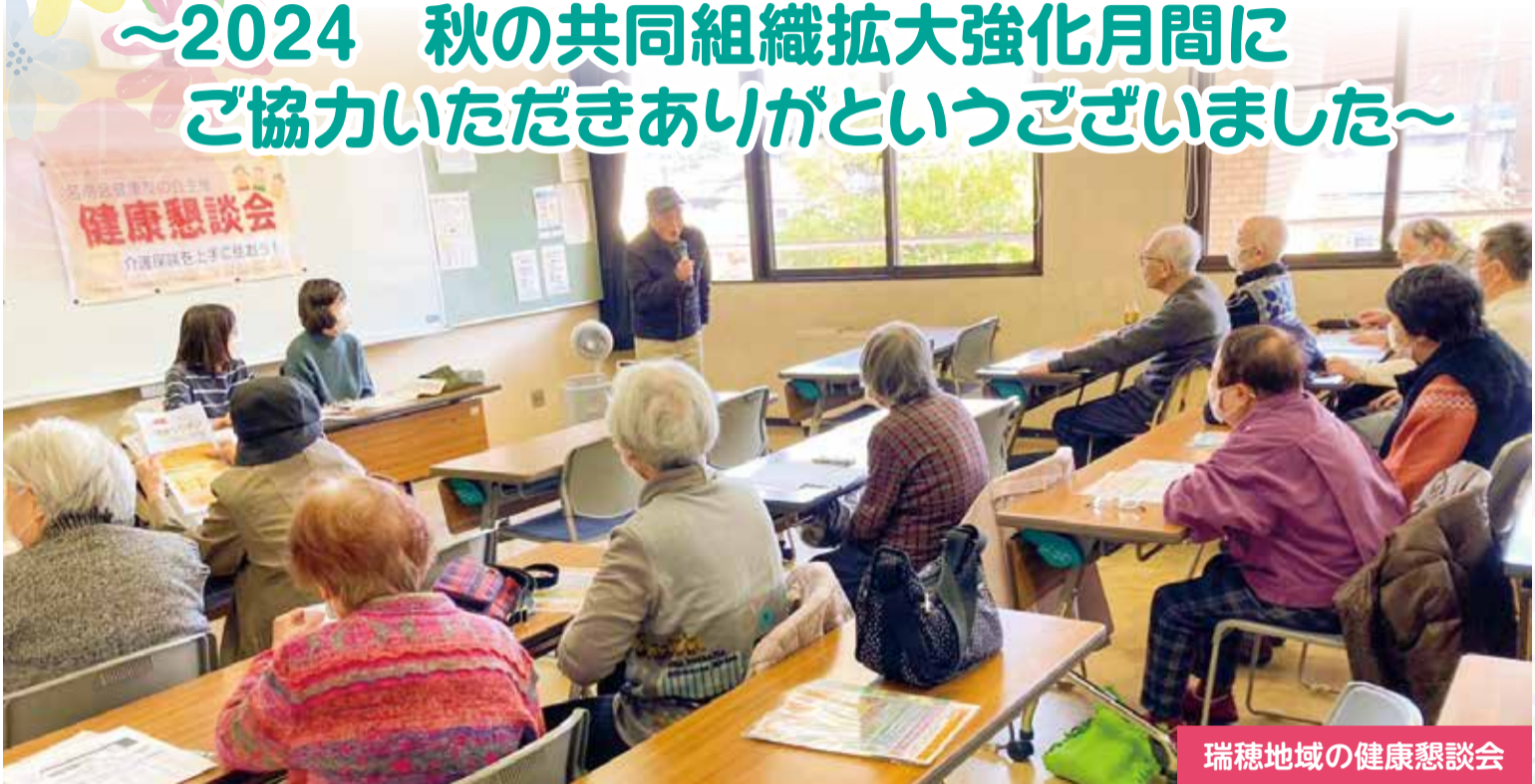
瑞穂地域の健康懇談会