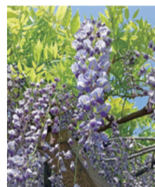
◆◆ 今月の花 ◆◆ ふじ