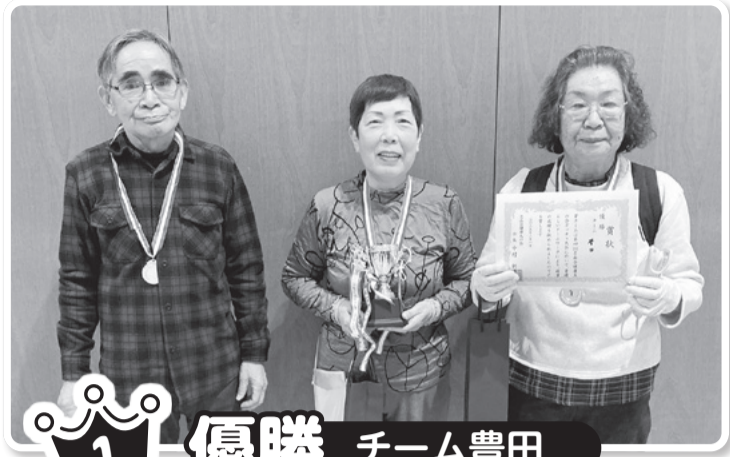
1 優勝 チーム豊田

優勝決定戦まで勝ち進み、久しぶりにワクワク・ドキドキ楽しい大会でした。惜しくも優勝逃がしましたが…ポッチャをやる事に感謝し、仲間を大切に思って次回は優勝目指して、がんばります。準優勝でしたが嬉しかったです。有難うございました。 石川さん