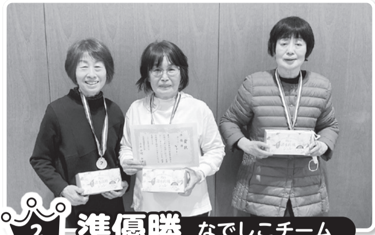
2 準優勝 なでしこチーム

優勝決定戦まで勝ち進み、久しぶりにワクワク・ドキドキ楽しい大会でした。惜しくも優勝逃がしましたが…ポッチャをやる事に感謝し、仲間を大切に思って次回は優勝目指して、がんばります。準優勝でしたが嬉しかったです。有難うございました。 石川さん