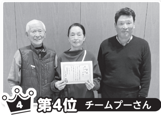
4 第4位 チームプーさん

第4回目にやっと優勝できました。3年過ぎてどこのチームも力をつけているので、私たちも僅差での勝利でした。試合中は応援と笑顔の拍手があって、とても素晴らしかったです。次回の開催が今から楽しみです。ありがとうございました。 中村さん