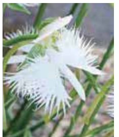
◆ 今月の花 ◆ サギソウ

平和と人権、いのちと健康が守られる社会の実現と「まちづくり」などあらゆる活動を友の会・地域の皆さんとともにすすめます。