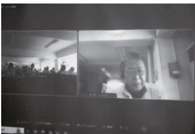
リモートにて現地の状況を報告いただきました

石川県健康友の会連合会では地震直後に「困難な時こそ、民医連共同組織」健康友の会の出番です！」としてすぐに以下の対応を取られました。