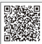
医療費に関するお問い合わせ・ご相談はこちらのホームページまで

当、給与変動があるため、受診毎に毎回状況を確認し、継続した治療を受けられるようにしようという意見交換を行いました。